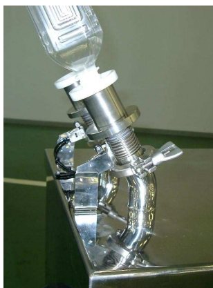
容器クリーニング

容器をノズル口に押し当てます。センサーがONし、イオン化したエアを一定時間容器に吹付けます。同時にブロアーで容器内を吸引し紙粉・樹脂片などを除去します。クリーニング時間はタイマーにて調整可能です。