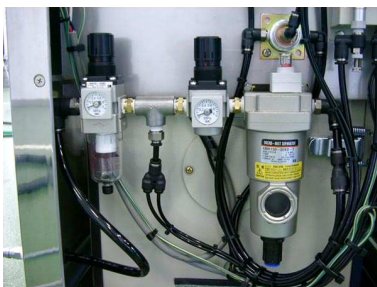
圧空供給位置とフィルター